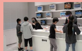
▲エアポートゾーン