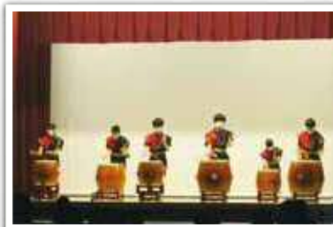
葉鴨北中学校会場

1年間の取組みを仲間とともに舞台上発表する児童・生徒の姿は、とても輝いていました。その姿に会場全体が感動に包まれ、大きな拍手とエールのなか、和やかなうちに幕を閉じました。