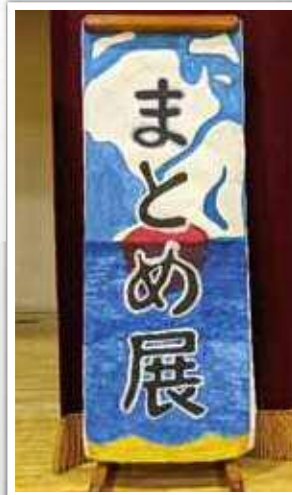
西池袋中学校会場