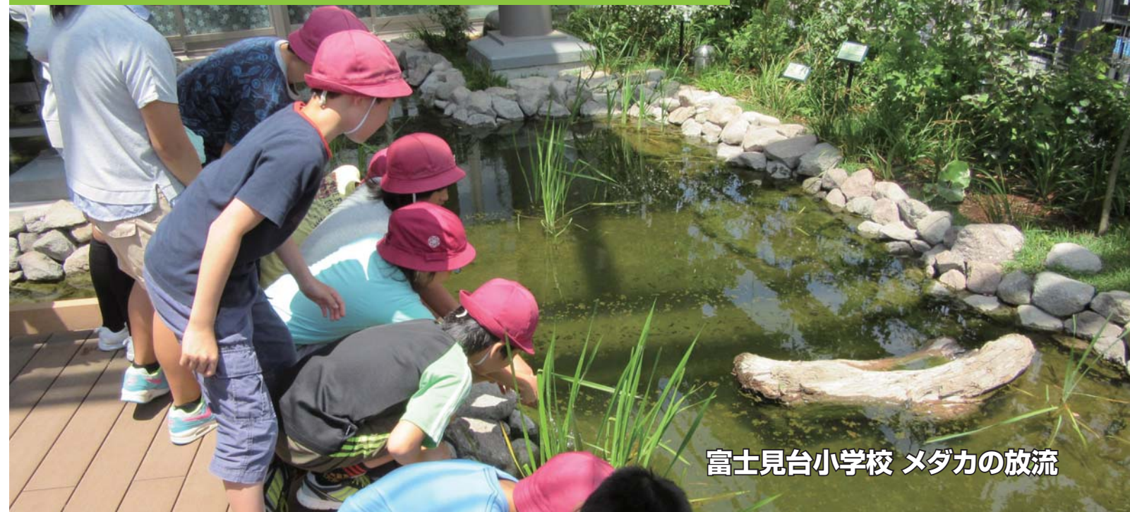
富士見台小学校 メダカの放流