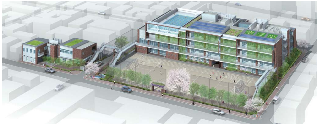
第5章計画の推進に向けて区長部局との連携