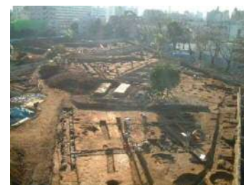
大名屋敷の発掘調査

この他に発見された遺構としては、旧石器時代の遺物集中地点、縄文時代早期の落とし穴・同中期の堅穴住居、弥生時代後期の堅穴住居群・方形周溝墓、室町時代の墓地・宗教施設・道路などがあり、遺物には古墳時代後期のものもある。