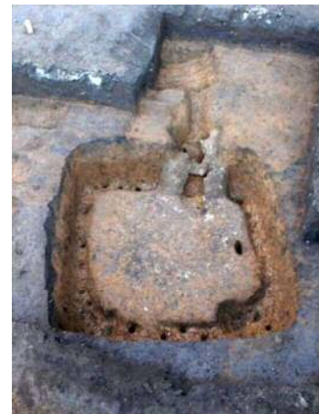
長崎一丁目周辺遺跡で発見された古墳時代の竪穴式住居

谷端川(現在は暗渠)に面する低い台地上に占地する。室町時代の墓地・屋敷跡発見され、遺物では板碑が多く出土する地域であることから中世から庶民の生活が営まれていたことがわかってきた。また、縄文時代の遺物、古墳時代終末期の竪穴住居跡、江戸時代の道路や住宅跡も発見されている。