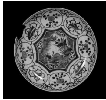
雑司が谷遺跡出土の肥前磁器の大皿

本遺跡は弦巻川(現在は暗渠)に面する台地上に占地している。雑司が谷鬼子母神境内およびその周辺は室町・江戸時代以来の信仰の場であり、寺社参詣を兼ねた江戸市民の遊興地ともなっていた。このため、鬼子母神参道周辺には江戸時代の料理屋関係の遺構・遺物が密集して残っており、また室町時代末ないし江戸時代初頭に営まれた住宅や墓なども発見されている。この他、旧石器時代の遺物集中地点が発見されているのをはじめ、縄文時代・弥生時代の遺物や、鎌倉街道と推定される道路跡も出土している。なお、地下鉄13号線雑司が谷駅建設に際して行った調査の結果、この遺跡が二丁目にも広がっていると推定されているほか、北側の周知範囲外でも江戸時代以前の信仰や埋葬に関わる遺構や遺物が不時発見された事例がある。