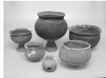
駒込一丁目遺跡出土の弥生土器