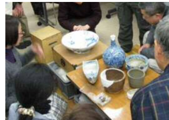
区民講座などで資料を活用