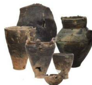
池袋東貝塚で出土した縄文時代後期の土器

氷川神社裏貝塚のある台地下の東側段丘上に占地し、谷端川に注ぐ小谷の入口部に面している。縄文時代の貝塚が存在することは明治時代には知られていたが、その後の開発により正確な位置は不明となっていた。2017年の発掘調査で、縄文時代後期の貝塚が再発見された。また、これまでには弥生時代後期の集落や、室町時代から江戸時代のものと思われる道路も発見されている。さらに、縄文時代前期から晩期にいたる各時代の土器や、古墳時代・平安時代・室町時代の遺物が出土している。