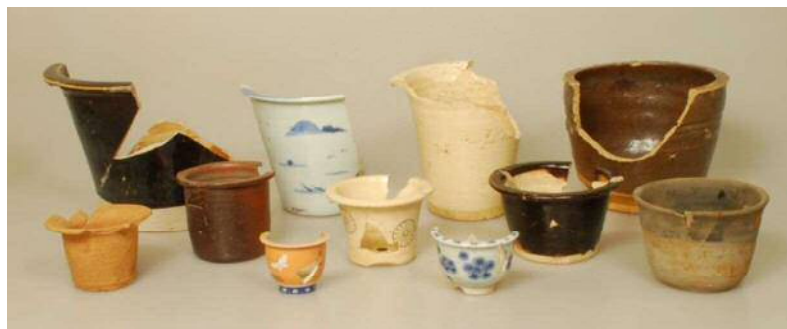
巣鴨遺跡から出土した植木鉢