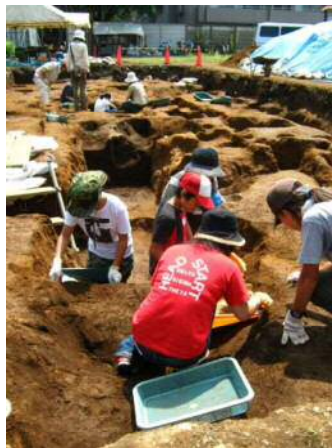
染井遺跡で遺跡発掘体験

近年の市街地再開発に伴い、豊島区でも周知の埋蔵文化財包蔵地内での開発行為が増加しており、日本の歴史や地域の歴史を知る上で貴重な遺跡が、破壊され失われていく危機に直面しています。豊島区ではこうした遺跡の保存・保護のために、次のような手続きをお願いしています。