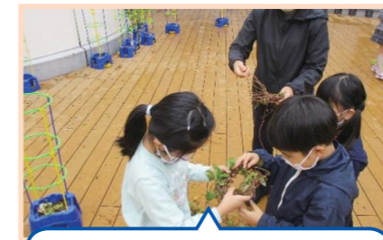
あさがおの蔓からリース作り