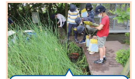
校庭から始める環境学習