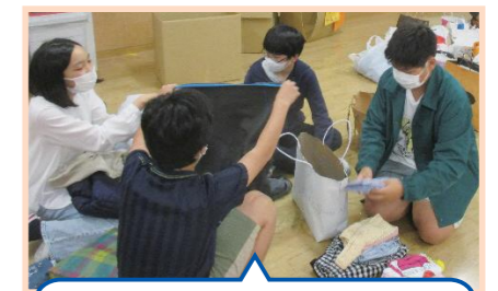
服のチカラプロジェクト