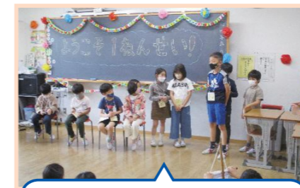
ウェルカムパーティー