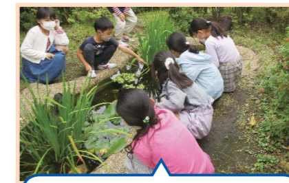
教室で育てた大好きな生き物たち