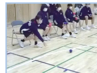
オリパラレガシーボッチャ大会 インクルーシブ活動