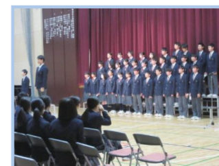
れんが祭舞台発表の部