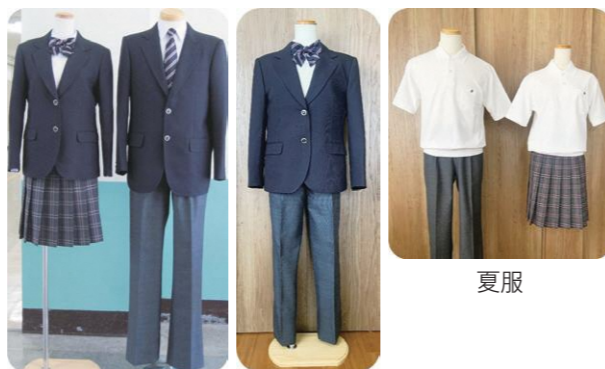
II型 I型 II型