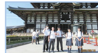
3年修学旅行(奈良・京都)