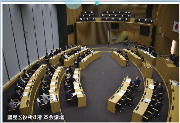
豊島区役所8階 本会議場