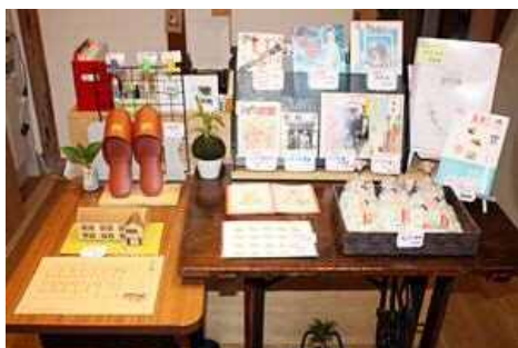
関連グッズ：トキワ荘関連グッズを販売