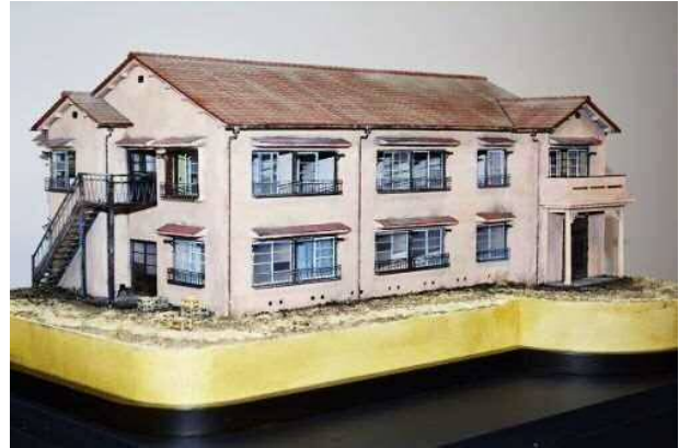
平成 27 年度「トキワ荘等に関する基礎調査」で作成したトキワ荘復元模型（1/50）

その後、昭和 57 年 12 月、トキワ荘は老朽化により解体され、新たなアパートとして生まれ変わりましたが、それも平成 12 年頃解体され、現在、跡地には出版社の社屋が建っています。