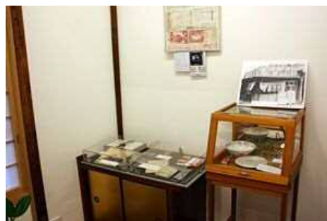
関連資料コーナー：寺田ヒロオの腕時計、「エデン」のマッチ、「松葉」のどんぶりなどを展示