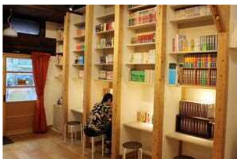
閲覧コーナー：トキワ荘関連の図書を配架