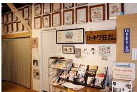
マンガ家のサイン色紙、寄せ書き、関連施設等のチラシを配置