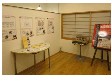
企画展示スペース：様々な企画に対応