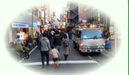
南北区道周辺の道路の荷さばき車両

A2 「荷さばき」とは、商品・物品等の配達や受け取りに関する一連の作業のことであり、荷物の運搬、積み替え・積み下ろし、検品、伝票整理等、荷物の運搬に係わる全ての作業を含みます。