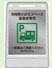
共同荷さばきスペース看板