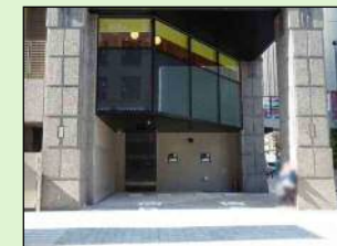
としま区民センター共同荷さばきスペース