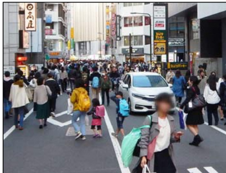
歩行者と自動車輻輳して危険な状況の南北区道

南北区道は、池袋駅東口の賑わいの拠点となぐ主要な道路で特に休日は多くの歩行者が通行していますが、歩道がないため歩行者が車道にまで溢れている状況です。しかし現状では、車両の通行が可能であるため、 車両と歩行者が輻輳し危険な状況となっています 。このため、歩行者の多い時間帯で南北区道の 車両通行を規制し、安全・安心な歩行者空間を確保していきます 。