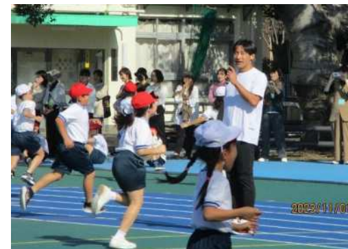
運動会で先生のかけ声のもと 一生懸命頑張っている子どもたち

○子どもたちの健やかな成長を後押しするため、定期健康診断・歯科健診等の充実を図ります。