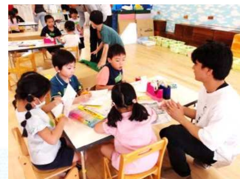
NPO団体「芸術家と子どもたち」による 学びの芽生えを培う表現活動