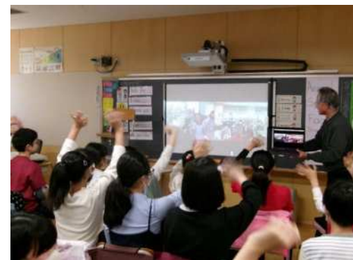
オーストラリア現地校と 英語でオンライン交流

○将来を生き抜く様々な資質・能力を育むために、学習情報センターの利用促進に加え、授業改善に向けた教員研修の充実を図ります。