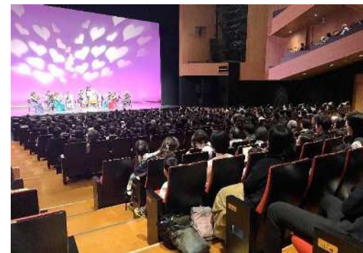
区立施設での芸術鑑賞 としま文化の日 東京都交響楽団コンサート

○学校の授業に地域人材を講師として積極的に招き、直接ふれあう中で、子どもたちが社会性を身につける機会を創出します。