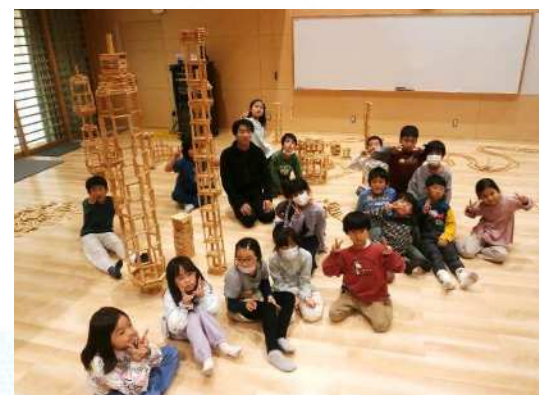
小学生の放課後の居場所 子どもスキップの職員と子どもたち