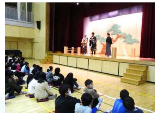
目白小学校 狂言鑑賞 日本の伝統芸能を小学校で鑑賞