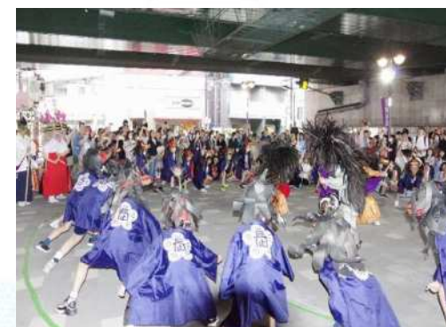
「長崎獅子舞」体験 豊島区指定無形民俗文化財