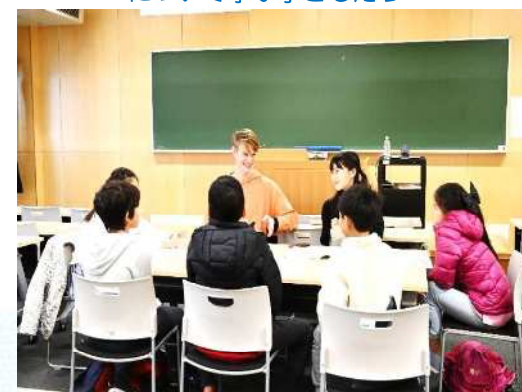
立教大学 イングリッシュキャンプ ゲームを通じた国際交流