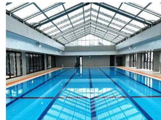
学習環境の改善 暑さ対策を施した室内プール

○一人一台タブレットパソコンの定期的な更新とともに、ネットワーク機器やプロジェクター等の基盤整備を進め、学習環境の質の向上を図っていきます。