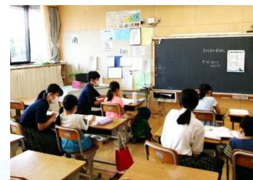
中学生のボランティアによる 小学生の夏休み学習教室