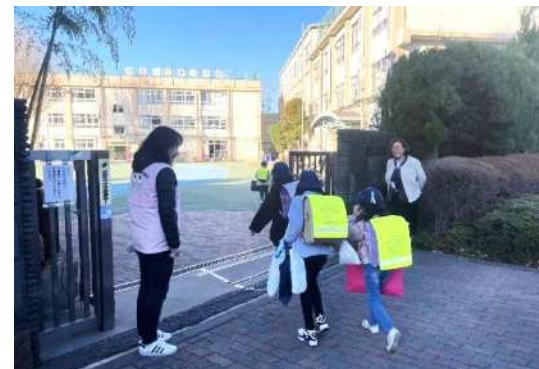
地域の方による登校時の見守り活動

○子どもスキップの運営に携わる人員を十分に確保し、子どもたちが放課後に安心して過ごせる場所を確保していきます。