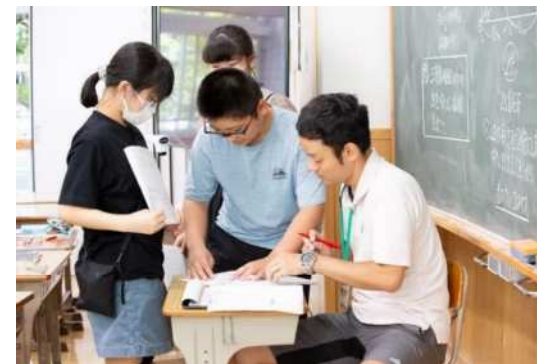
子どもたちの質問に答える小学校教員

○教員の働き方改革の取組みを保護者や地域、関係団体の方々にご理解・ご協力をいただき、地域一丸となって働き方改革を進めていきます。