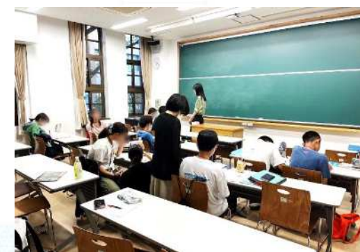
放課後を活用した学習の場 (学習院大学での「としま地域未来塾」)