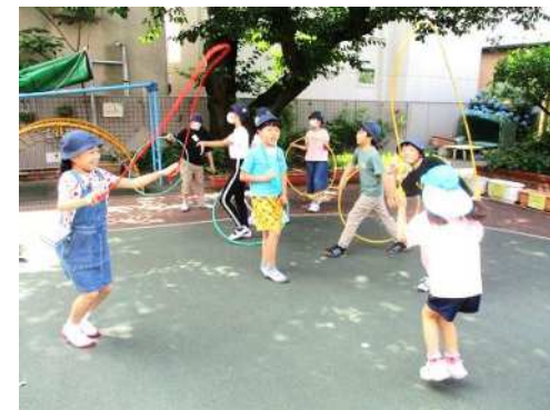
円滑な幼稚園への接続に向けた 近隣小学校との交流

○施設の種別や公立私立の別を問わず、幼児教育と小学校教育の円滑な接続を図るため、同じまちで育つ子ども同士の交流や職員の合同研修など、保育園・幼稚園・小学校の交流を深めていきます。