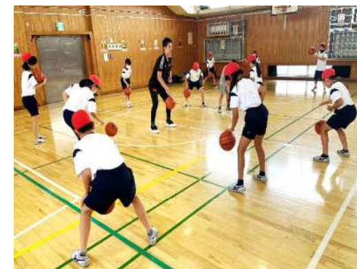
企業の講師によるバスケットボール授業

○中学生の部活動の機会を確保するため、部活動指導員を配置するとともに、専門性の高い外部指導者による技術指導を取り入れる等、部活動の質の向上を図りながら、地域移行を推進していきます。