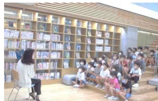
池袋第一小学校 学習情報センターでの 読み聞かせ

○子どもたちの主体的・対話的で深い学びの実現を目指し、蔵書の充実に加え、大型スクリーンや複合機等のICT機器の設置、学習スペースの確保など、快適な学習環境を整備していきます。