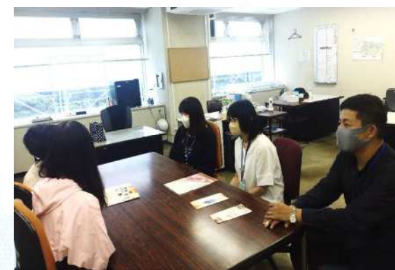
適応指導教室（柚子の木教室） 職員と利用者との面談