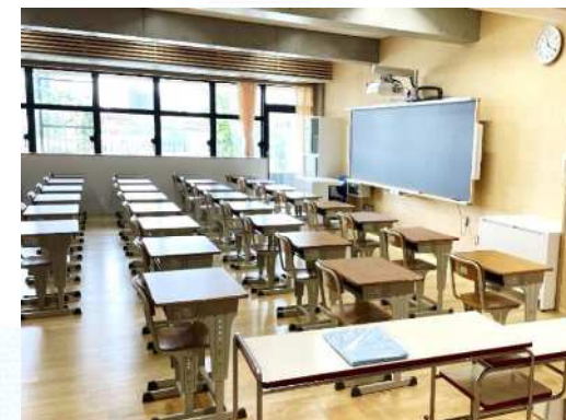
学習環境の質の向上 電子黒板等を備えた普通教室