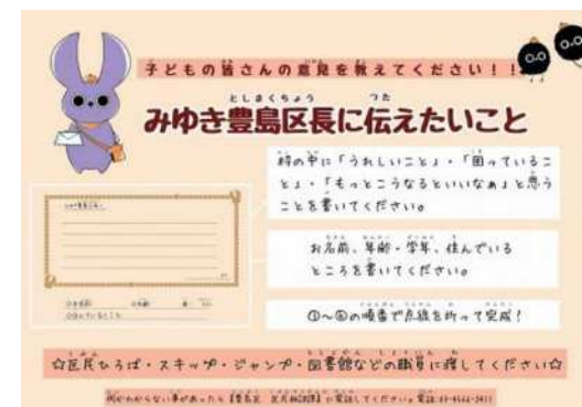
「子どもレター」 子どもの声をしっかりと受け止め区政に反映

○子どもたちが主体的に学ぶ授業を展開することにより、自らの個性や能力を伸ばし、自己肯定感・自己有用感の高い子どもを育てていきます。