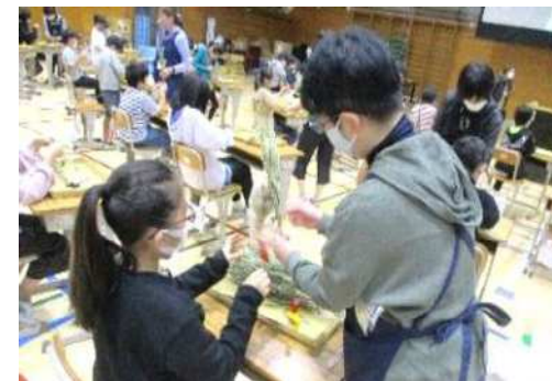
「雑司ヶ谷すすきみみずく」づくりの体験 地域の方々から作り方を受け継ぐ

◆豊島区内には、ソメイヨシノ発祥の地、雑司が谷すすきみみずく、トキワ荘、長崎獅子舞など、地域に根づいた歴史・文化が数多く存在します。また、東京手描友禅、東京籐工芸、東京組紐などの時代を超えて受け継がれてきた伝統工芸があります。一方で、後継者不足などから、その継承が課題となっています。 ○各教科等の授業において、地域資源を積極的に活用し、子どもたちが地域への理解を深め、地域を大切にする心を育んでいきます。 ○熟練技術者による技術の実演やものづくり現場への訪問などを通して、子どもたちのものづくりへの興味・関心を高めていきます。