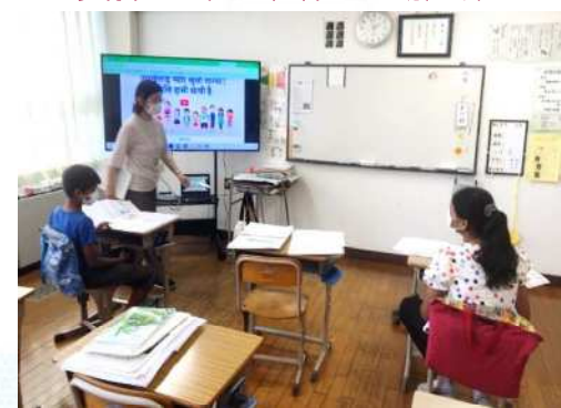
日本語指導学級 担当教員によるきめ細やかな少人数指導