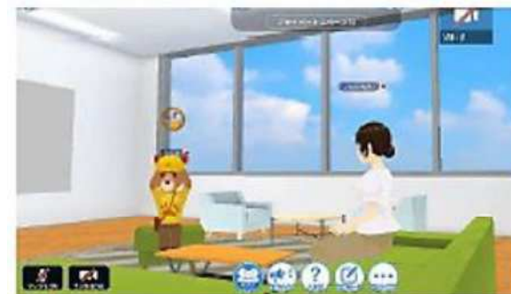
VLP（バーチャル・ラーニング・プラットフォーム）を活用した不登校支援（心理士等との面談）

○様々な状況の子どもに寄り添い、関係機関や専門家との連携により、きめ細かなサポートを行うとともに、学校以外でも友達との交流や学習が行える環境を整備していきます。