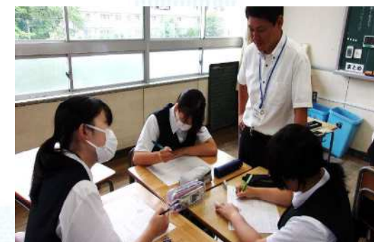
子どもたちの学習の様子を見守る中学校教員