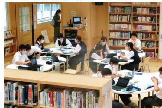
巣鴨北中学校 学習情報センターでの個別学習