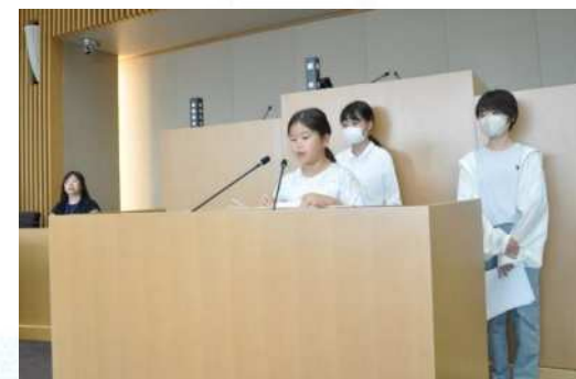
「としま子ども会議」 区政などについて話し合い意見表明