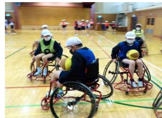
車いすバスケット体験 多様性に気づき他者への理解を深める

○人権教育や道徳教育を充実させることで、子どもたちが様々な体験や人との関わりの中でその多様性に気づき、自分も人も大切にできる心情や他者を認める社会性を身につけ、心のバリアフリーを実現します。