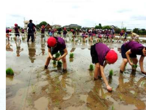
自然体験「田植え」を通して 食育に繋げる