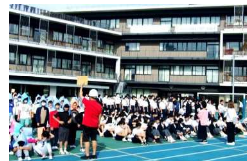
池袋本町小学校と池袋中学校の 合同避難訓練