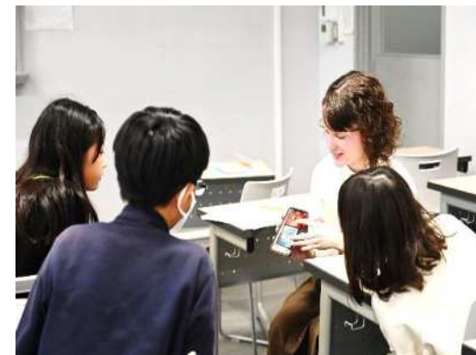
留学生から他国の文化や言語について学ぶ子どもたち

○区内大学等と連携し、小・中学生が留学生等と交流する機会を設け、異なる文化や価値観を認め合い、関係を構築するためのコミュニケーション能力を養うことで、国際社会の一員として活躍できる人材を育てます。