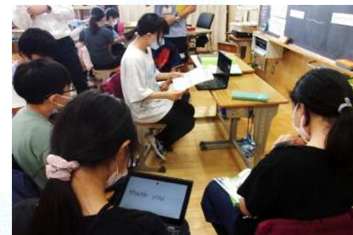
複数の外国の講師と 一人一台タブレットを活用した交流