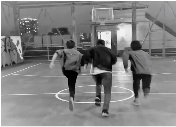
豊島区立中高生センター