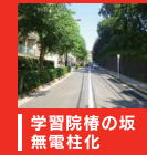
学習院橋の坂 無電柱化