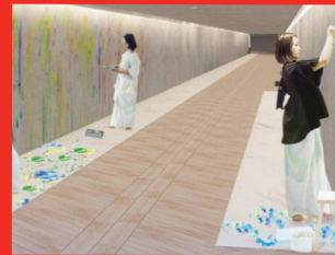
ウイロードの改修