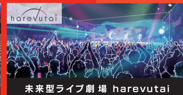
未来型ライブ劇場 harevutai