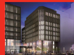
としま区民センター