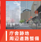
庁舎跡地 周辺道路整備