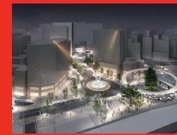
大塚駅周辺整備 (北口)