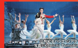
小林 紀子バレエシアター