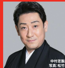
中村 歌右衛門