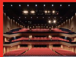
東京建物 Brillia HALL 豊島区立芸術文化劇場