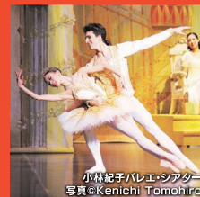
小林 紀子バレエシアター