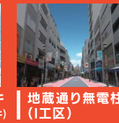
地藏通り無電柱化 (I工区)