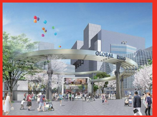
池袋西口公園 リニューアル