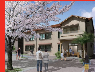
(仮称)マンガの聖地 としまミュージアム