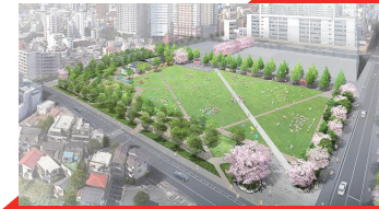
(仮称)造幣局地区防災公園