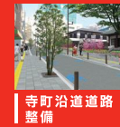
寺町沿道道路 整備