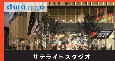
サテライトスタジオ