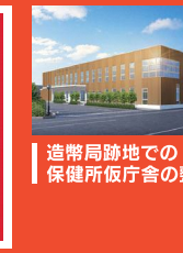
造幣局跡地での 保健所仮庁舎の整備