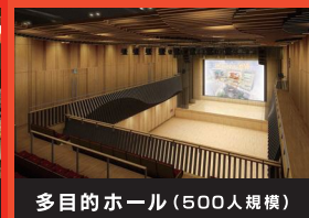
多目的ホール(500人規模)