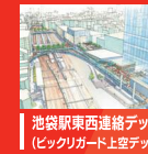
池袋駅東西連絡デッキ (ビックリガード上空デッキ)