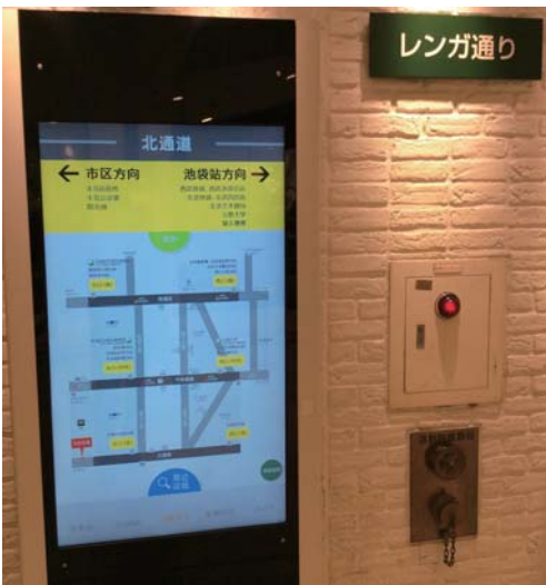
(池袋ショッピングパークレンガ通りに設置された多言語対応デジタルサイネージ)

さらに、新区民センター1階には、多言語対応の総合インフォメーションを整備します。