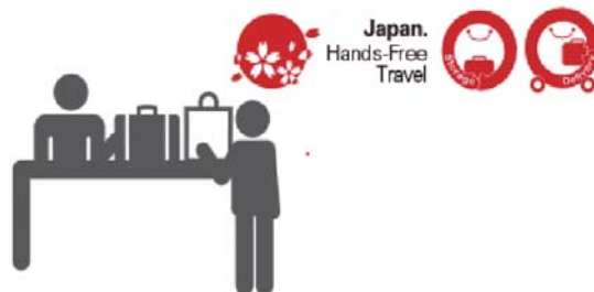
(手ぶら観光共通ロゴマーク)

平成32年(2020年)にオープン予定の新区民センターにも、手ぶら観光ができる機能を導入する予定です。