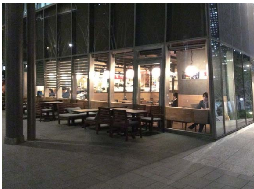
(サードプレイスのイメージ)

演劇、アート、サブカルチャー等の鑑賞を楽しんでいた後に、飲食をしながらゆっくと余韻を楽しんでいただけるような空間作りを実現していきます。